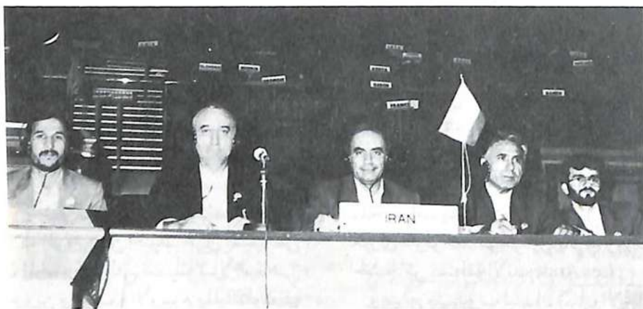
ممثل الدولة الإيرانية

وزيلندا الجديدة) وأوربا (١٠ بلدان) على أكبر كمية تم حجزها بأوربا (٧٥٧ ١٤٤ جرعة) وأكبر جزء يعود للمملكة المتحدة، ويكاد يتخصص بإنتاج هذه المادة الولايات المتحدة والبلدان المنخفضة، وإذا كان عدد المدمنين بالولايات المتحدة مرتفعا جدا فإنه لم يتم إلا حجز ١٢٧ جرعة من الـ د س بالبلدان المنخفضة. ويكاد يكون المزود الوحيد لأستراليا وزيلندا الجديدة الولايات المتحدة علما بأن المخدرات تأتي من البلدان المنخفضة، ويبدو أن في