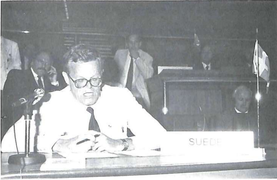
السيد أريكسون إنتخب رئيسا مساعدا لأوروبا