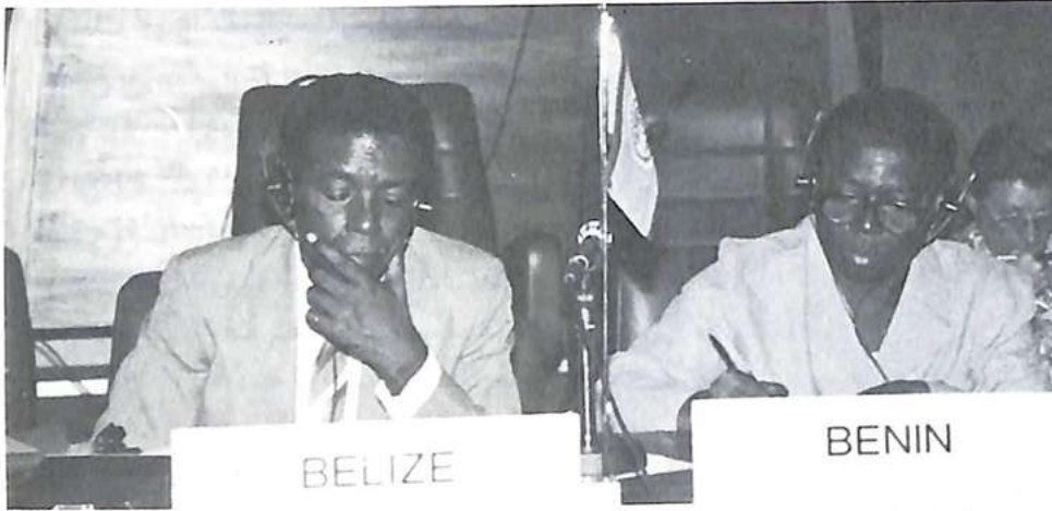
مندوبو البليز والبنين

لقد شهدت سنة ١٩٩١ في البداية تشغيل الشبكة ٤٠٠ × انطلاقا من شهر تشرين الأول-أكتوبر حامله أولى نتائج ثلاث سنوات مجهودات مستمرة نحو هذا الهدف؛ وقد تمت أول عمليات ربط