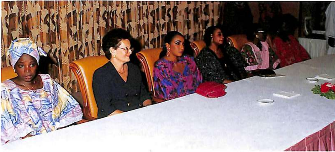
وليمة نظمت بمناسبة الاستعراض الفخم للأزياء وقد قدم أثناءه فستان انتربول.

عليها مبرزة الحدث : إنه السات-سيتال Set-Sétal. لقد تولدت في هؤلاء الشباب الرغبة في أن يجعلوا مدينتهم أنظف وأكثر جاذبية. والطقس في العاصمة مثالي بفضل حماية الراس الأخضر ورياح الاليزي التي تلتطفه. أما النشاطات الاجتماعية فقد بدأت هذه السنة يوم الثلاثاء الثالث من تشرين