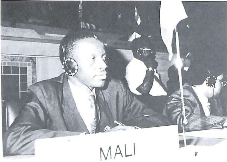
عضو من الوفد المالي

جهاز البحث الأوتوماتي (ASF) وثيقة سفر : سيضبط ملف إعلامي مماثل على جهاز البحث الأوتوماتي للبحث وتصفح صور وثائق سفر حقيقية أو مزيفة (جوازات سفر، وبطاقات تعريف) مثل هذا الجهاز (بالألوان) تم ضبطه بالمكتب المركزي الوطني بالبلدان المنخفضة حيث اقترح الاخصائيون مساعدة موظفي الأمانة العامة .