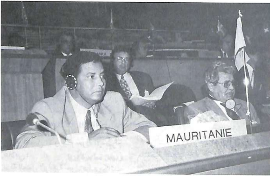
جزء من الوفد الموريطاني