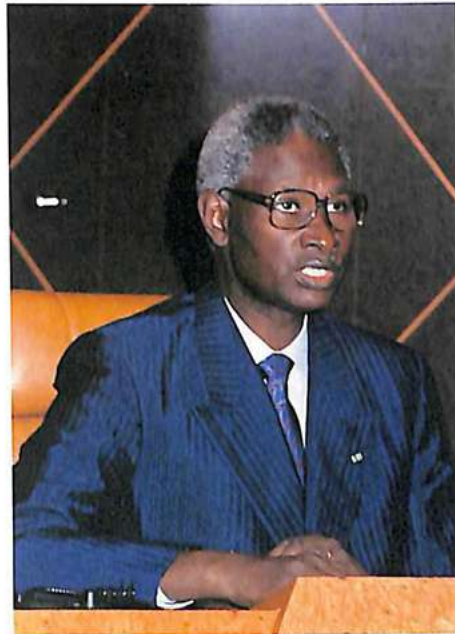
السيد عبدو ضيوف رئيس الجمهورية يقدم للجمعية تنبأته بالنجاح .

وفي ختام كلمتي، اسمحوا لي سيدي رئيس الجمهورية، سيداتي وسادتي بتقديم