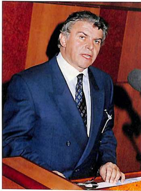
السيد إيفان بربوت رئيس المنظمة يشكر السنغال على حسن استقباله ويقدم أهداف الدورة الواحدة والستين للجمعية العامة .

وهذا المخطط الخماسي للمساعدة التقنية - الأول من نوعه - التي وضعته المنظمة ، سيتمكن من الآن حتى عام ١٩٩٧ من تحسين تجهيزات نقل انتربول لشرطة الجهات السائرة في طريق النمو ؛