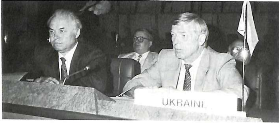
مندوبو ليطونيا وناميبيا وصلوفانيا وأكرانيا.