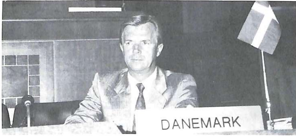
إحدى ممثلي الدنمارك

أن تملك تجهيزا عصريا متلاحما يمكن من التبليغ بصفة مرضية حسب معيار ٤٠٠× ويمكن إقامة أجهزة بحث أوتوماتي ASF جهوية، وتمثل هذه السياسة مشروعا مهما وطموحا للسنوات المقبلة.