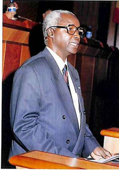
السيد دينغ وزير الداخلية بالسنغال أثناء خطابه الترحيبي

ويشرف السنغال، عضو انتربول منذ ١٩٦١، أن يستقبل دورة الجمعية العامة للم-د-ش-ج-انتربول في دورتها الـ ٦١ على صعيد الأرض الأفريقية، علما بأن آخر جمعية التأممت على هذه القارة كانت أثناء الدورة ٤٨ بنيروبي سنة ١٩٧٩ . من أول مؤتمر الشرطة العدلية الدولية الملتئم بموناكو سنة ١٩١٤ إلى دورة دكار