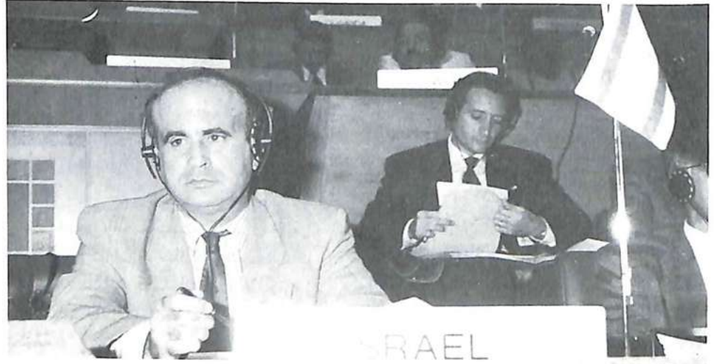
إحدى ممثلي الوفد الإسرائيلي

في سنة ١٩٨٧ كان جهاز البحث الأتوماتي يعتبر قمة التقدم وكان عليه أن