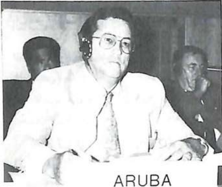
السيد بترسن رئيس وفد أروبا وعضو اللجنة التنفيذية