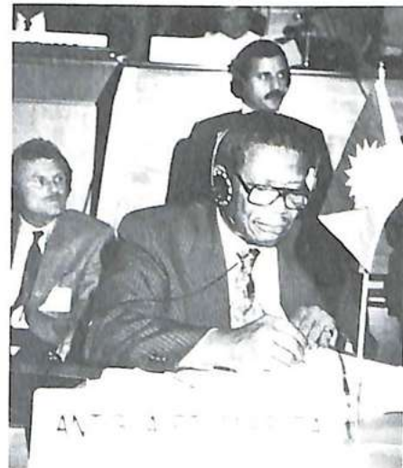
مثل أنتيغوا وبربودا

يؤمن المراقبة المالية للمنظمة على الصعيد الخارجي متبئ خارجي وعلى