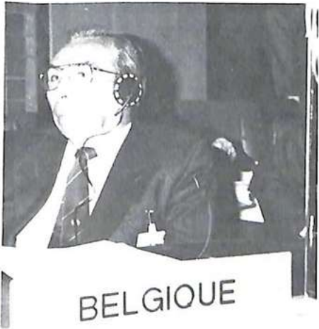
أحد ممثلي بلجيكا

جهاز الوثائق (Archives) : دخل هذا الجهاز مرحلة الانتاج ابتداء من تشرين الأول-أكتوبر ١٩٨٩ وتستجيب تمام الاستجابة لحاجات المنظمة ، وفي نهاية سنة ١٩٩١ شغلت ٢٥ اسطوانة بصرية عديدة وهو ما يوافق ٦١ ألف ملف مصور بواسطة الأشعة أي ما يقرب من ٦٠٠ ألف صورة لمثاتي ألف رسالة مخزنة ؛ وتم إيصال عشرين محطة و ٣ أجهزة تصوير بالأشعة (Scanner) بهذا الجهاز وكانت أزمنا الإجابة الملاحظة موافقة للمميزات المحددة .