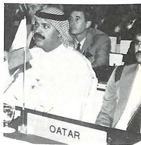
La delegación de Qatar

El enlace con las otras organizaciones internacionales es una de las funciones importantes de la Subdivisión de Estupeficientes. Además de las reuniones organizadas por la propia Subdivisión, conviene citar la 2.ª Conferencia policía-aduana en Bruselas (Bélgica) en mayo, organizada conjuntamente con el Consejo de Cooperación Aduanera; la participación, en junio, en la Conferencia mundial sobre drogas, organizada en Viena (Austria) bajo la égida de Naciones Unidas, en la 10.ª sesión extraordinaria de la Comisión de Estupeficientes y en la Subcomisión de tráfico de drogas y de problemas emparentados en Próximo y Medio Oriente. Finalmente, el trabajo realizado por la Subdivisión y la Organización Mundial de la Salud para controlar las drogas ilícitas e inscribirlas en los cuadros apropiados ha sido particularmente fructífero. El traslado reciente del secobarbital del