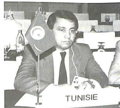
El delegado de Túnez

El 9 de marzo de 1987, se creó una nueva división —«Apoyo Técnico»— en el marco de la reorgani-