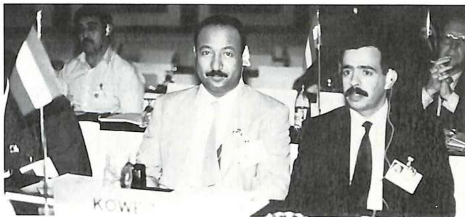
La delegación de Kuwait

Ahora bien, el sistema actual, que consiste en examinar los mensajes