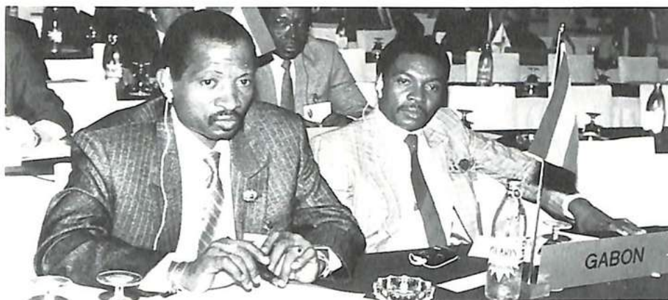
La delegación del Gabón

puedan hacer uso de ella, entre otros, sus respectivas autoridades represivas, y