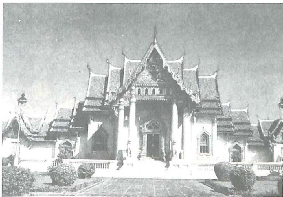
Wat Benchamabophit, el templo de mármol

ficticio de toma de rehenes; adiestramiento de una unidad canina; motociclismo y tiradores en ejercicios conjuntos, y despliegue policial en situaciones de alteración del orden público.