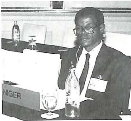
El delegado de Niger