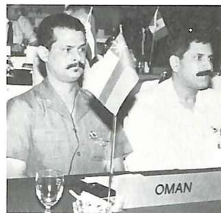
La delegación del sultanato de Omán

A partir de una propuesta de la delegación de Canadá, la Asamblea General, reunida en Niza, en 1987, había decidido la creación de un grupo de trabajo encargado de estudiar los problemas relativos a la utilización internacional de documentos de viaje fraudulentos. El grupo, que se reunió en Saint-Cloud, en junio de 1988, definió un documento de viaje como todo documento que puede servir para pasar una frontera. Debido al problema de la utilización de documentos de viaje fraudulentos, ha resultado necesario iniciar un esfuerzo concertado con el fin de aprehender y de procesar a los responsables de la producción y del uso de tales documentos. El grupo invita a los países miembros a