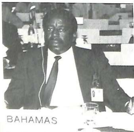
Un delegado de las Bahamas

La Organización necesita proteger sus comunicaciones contra las intrusiones. Las vías ARQ, que pueden ser interceptadas fácilmente por radioaficionados, han sido codificadas a partir de mediados de noviembre de 1987. Las otras vías: télex, teletex, transpac o los enlaces especializados, están naturalmente protegidos contra la escucha del aficionado. En estas vías, la interceptación, aunque es difícil y requiere medios, es, no obstante, posible. Por lo tan-