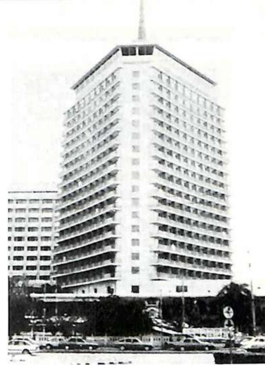
El hotel Dusit Thani, donde se han desarrollado los trabajos de la Asamblea General

El punto neurálgico de este programa es el establecimiento de una red mundial de telecomunicaciones al servicio de los países miembros