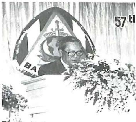
El general Chatichai Choonbavan, Primer Ministro de Tailandia, en la tribuna

organizaciones y entidades internacionales que participan en esta reunión.