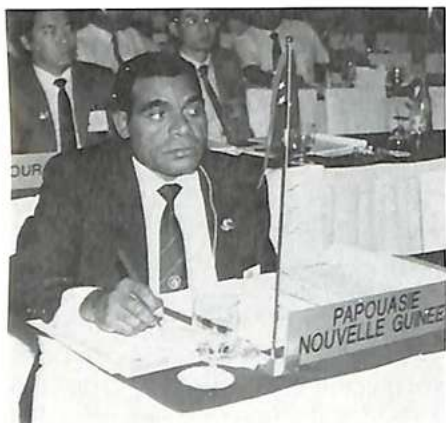
Un delegado de Papuasía-Nueva Guinea

Los sectores de la delincuencia. Este grupo está destinado a convertirse en servicio de estudio de la delincuencia, estructura que será encargada de comunicar al jefe de la División de Policía las características y la evolución de la delincuencia, observadas o previstas, con el fin de que este último pueda definir la política y los objetivos de la División de Policía. Sus principales misiones son las siguientes: análisis y coordinación de la información; organización de reuniones de trabajo sobre las investigaciones en relación con las actividades del grupo; cooperación con las organizaciones internacionales; elaboración de una legislación-tipo; puesta al día de la Enciclopedia de hechos financieros; difusión de documenta-