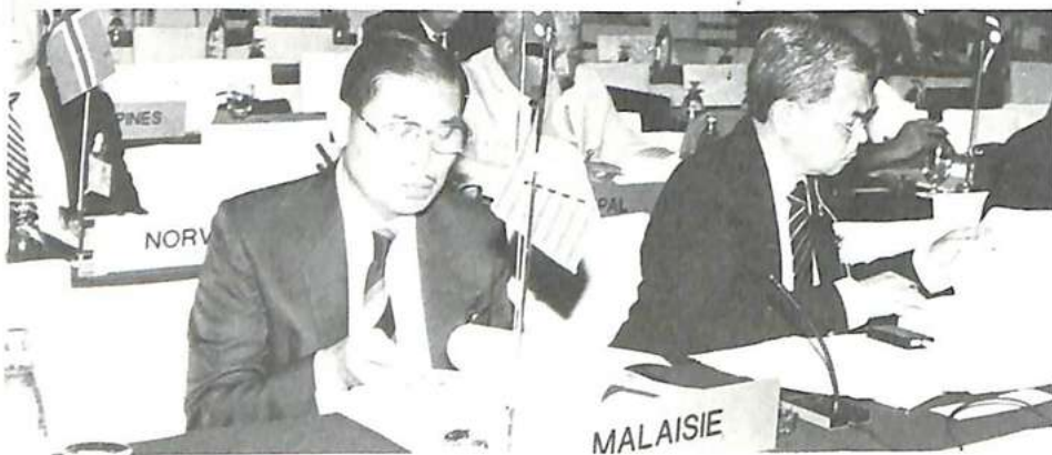
Dos delegados de Malasia