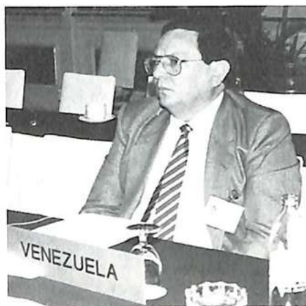
Un delegado de Venezuela

Una subdivisión agrupa al conjunto de servicios encargados de