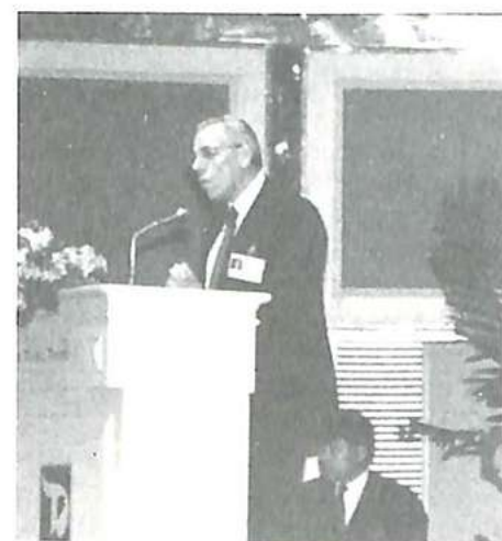
M. John Simpson, Presidente de la O.I.P.C.-Interpol, durante su alocución

Finalmente, Su Excelencia el General Chatichai Choonhavan, Primer Ministro de Tailandia, se expresó como sigue: