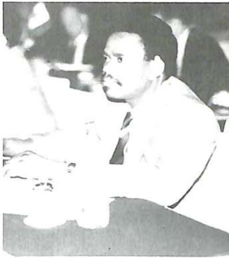
El delegado de Burkina Faso

que el ejercicio de tales funciones requiere que el Comité esté compuesto por delegados de Estados miembros cuya situación en materia de contribuciones esté al día, se propone a la Asamblea para su votación que se añada una disposición al actual artículo 52 del reglamento general de la Organización.