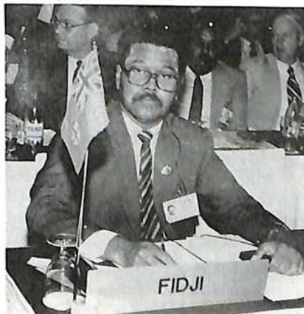
El delegado de las islas Fidji

confiscar los fondos de tráficos y todo cuanto sirva para blanquearlos; y a cooperar lo más posible en las pesquisas policiales y en los procedimientos judiciales;