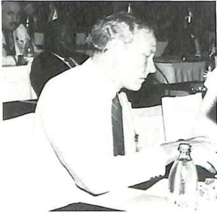
Un delegado de Finlandia

Según toda probabilidad, el terrorismo internacional va a seguir siendo a corto plazo una de las mayores preocupaciones de la policía y, por ello, la cooperación internacional es necesaria, y la Organización podría ser uno de los órganos de coordinación de una cooperación tal.