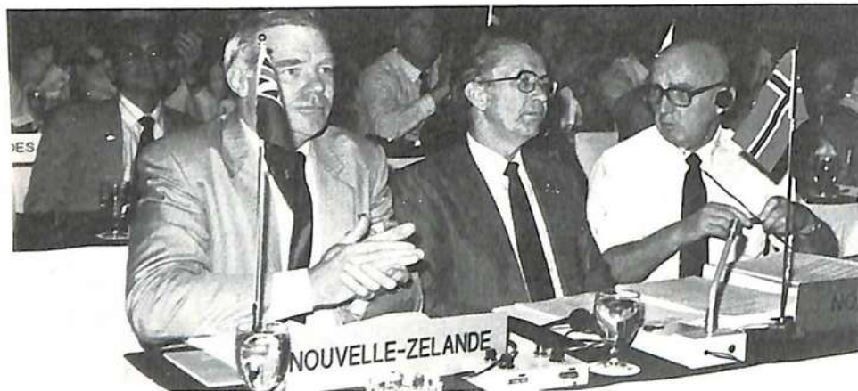
El delegado de Nueva Zelanda y la delegación de Noruega

Del 22 al 26 de junio se celebró en Lyon (Francia) la 7. a Conferencia Internacional sobre falsificación de moneda, organizada por la Secretaría General con la participación financiera de los bancos emisores y de los participantes del sector privado. La conferencia anterior había tenido lugar en Madrid (España).