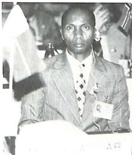
La delegación de Madagascar