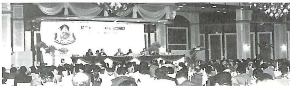
Vistas de la sala de conferencias donde se han desarrollado las sesiones plenarias

El delegado de Francia declara que su país colabora activamente en el desarrollo de la red informática y principalmente de la infraestructura de telecomunicaciones. Francia ha seguido con interés el proyecto del Caribe y ha participado en la conferencia regional del Caribe. Ha dado su acuerdo de principio para su participación en este proyecto con el FNULAD y la O.I.P.C. El principio de una participación financiera francesa para contribuir al mini-A.M.S.S. de Puerto Rico ha sido adoptado.