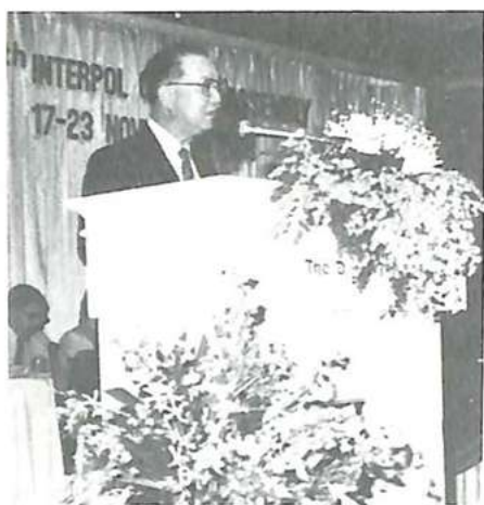
El general Pow Sarasin, director general de la Policía Real tailandesa, pronunciando el discurso inaugural

Estos dos proyectos para la región del Caribe constituyen un progreso real hacia la modernización, y espero que sirvan de ejemplo a otras regiones.