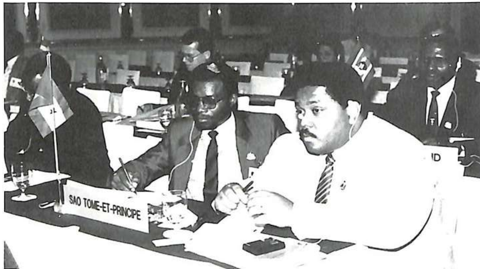
La delegación de Santo Tomé y Príncipe

La O.I.P.C.-Interpol cuenta, de aquí en adelante, con 147 miembros.