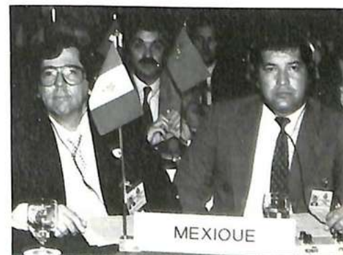
Dos delegados de Méjico

De aquí a cinco años, las estaciones regionales deberán estar equipadas mini-A.M.S.S. de normas X.400. La necesidad y el interés de esta evolución son comparables a los que la mayoría de los países del mundo han encontrado evolucionando del servicio manual al automático en sus instalaciones telefónicas. Los soportes