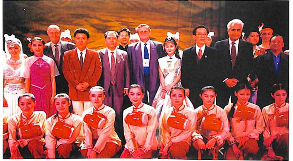
صورة تذكارية بعد حفل الرقص الفولكلوري الصيني.

وانطلاقا من ساحة نيانمان ومرورا بالجسور الخمسة التي تعبر الخندق الذي يحمي مدخل المدينة المحظورة وصلنا إلى سفح السور الذي يحيط بها. ففي كل مثلث تنتصب أبراج مراقبة ذات ثلاثة طوابق لها سطوح بارزة تشتمل على أفاريز ثلاثة وعدد كبير من