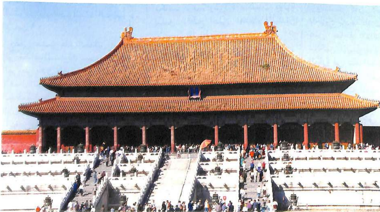
على صفحة اليسار نزهة على السور العظيم «مدخل المدينة المحظورة»

وفعلا، فالحدائق الصينية التي تضاد هندسة المباني التي تعتمد الخطوط المستقيمة المتناظرة تكون فضاءات تغلفها الجدران وتعتبر كامتداد أو