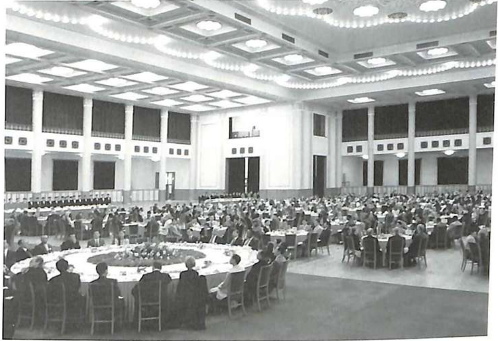
مأدبة عشاء أقامها وزير الأمن العمومي بالصالون المركزي لقصر جمعية الشعب.

وفي مساء يوم الخميس أقام الرئيس والأمين العام حفلا ساهرا بصالونات نزل