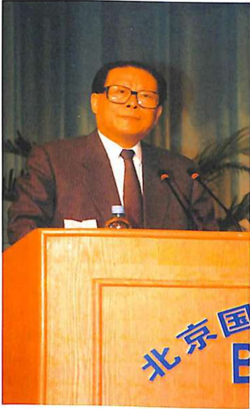
السيد إينغ زمين رئيس جمهورية الصين الشعبية أثناء إلقائه خطاب الترحيب

وإرشادات شرطة، مهارة في مجال جمع وتحليل وتوزيع استعلامات شرطة؛ مهارة في ميدان تبليغ النتائج المهمة حول هيكله النشاطات الإجرامية - مهارة في مجال وسائل المحافظة على الثقة بين موظفي الشرطة، كل هذه العناصر وغيرها جعلت من انتربول منظمة لا مثيل لها.