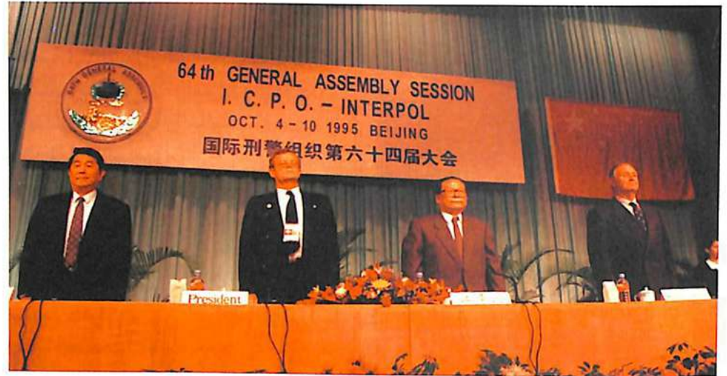
منظر جانبي من المنصة الشرفية أثناء حفل الافتتاح

- مبادرات جهوية - تم القيام بمبادرات جهوية بإفريقيا وأمريكا الجنوبية وكذلك بأوروبا الوسطى وأوروبا الشرقية قصد تدعيم التعاون بين البلدان الأعضاء. وعلى أرض هذه القارة الآسيوية التي تحتضننا نجد أن مكتب الإتصال بينكوك أحسن مثل يضرب في هذا المجال وكذلك المشروع المتعلق بضباط الإتصال الآسيويين الذي أقيم بسرعة.