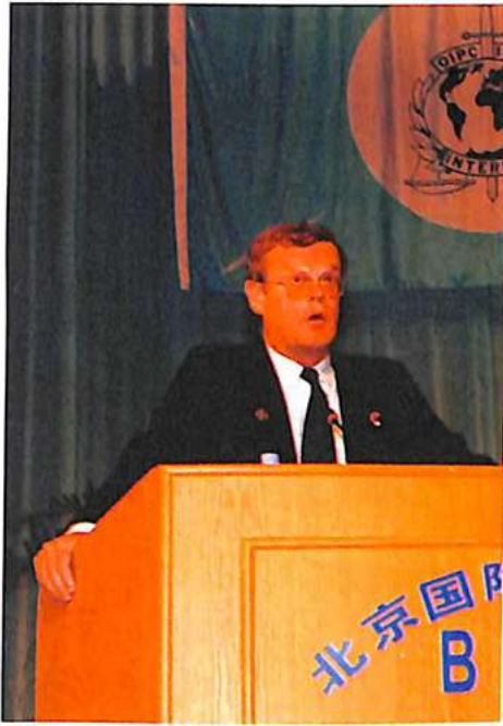
السيد أركسن رئيس الم د ش ج - انتربول أثناء خطابه الافتتاحي.

يضم ١٣٥ بلادا ممثلة فحسب وإنما لأننا في معظمنا موظفو شرطة ومهنتنا مكافحة الإجرام وقد اكتسبنا في ذلك تجربة مهنية كبيرة. والأهم هو أننا التزمنا جميعاً وشرعنا في مكافحة الإجرام، إضافة إلى أننا اخترنا مكافحة الإجرام الدولي في إطار الم د ش ج - انتربول ويبرر هذا الاختيار إلى حد كبير أن قانون الم د ش ج انتربول الأساسي يمكن البلدان الأعضاء من التعاون في هذا الكفاح بمرونة كبيرة في كنف احترام مختلف التشريعات الدولية.