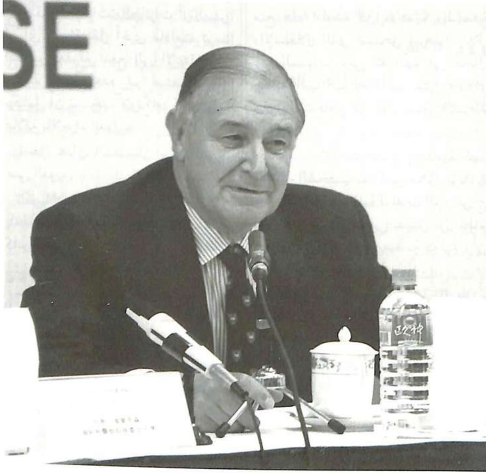
السيد ريمون كندال تم تجديد وظائفه أميناً عاماً للمنظمة