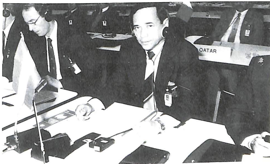
El delegado de Paraguay.

La única sustancia de la que se señalan incautaciones regulares a