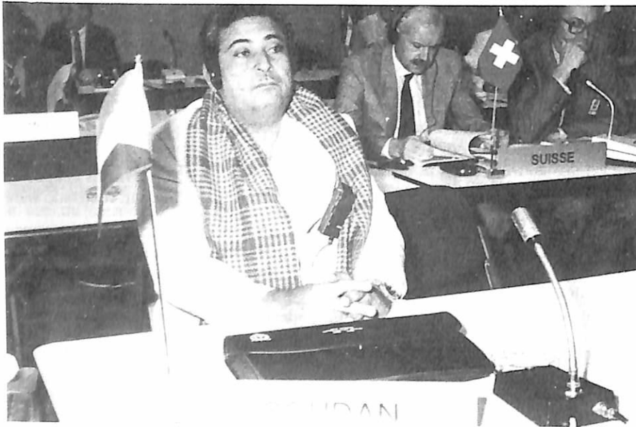
El delegado de Sudán

Este grupo está especializado en delitos contra los bienes (robo y tráfico de objetos de arte y de bienes culturales), robo y tráfico de vehículos de motor, robo y tráfico de armas y de explosivos, robo con fractura, robos en general, así como en otros delitos afines. Un funcionario se ocupa también de los asuntos relacionados con el tráfico de especies animales y vegetales en vías de desaparición que constan en la Secretaría General. Existe estrecha relación entre la Unesco y el Icom (Consejo