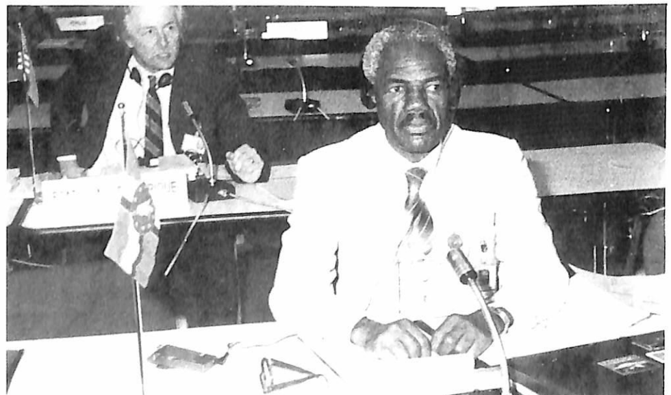
El delegado de Dominica.

La subdivisión 2 (delincuencia económica y financiera, y falsificación de moneda) está formada por tres grupos. A comienzos de 1988, se hizo depender de la autoridad de un funcionario uruguayo.