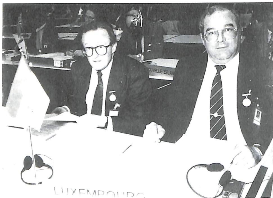
Dos representantes de Luxemburgo.

trucción de 5.541 hectáreas de plantaciones. Al ser el rendimiento de unos 15 kilos de opio por hectárea, estas medidas de destrucción han impedido por lo tanto la producción de más de 83 toneladas de opio.