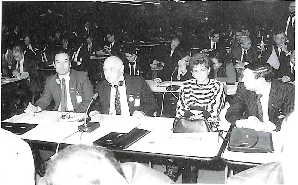
La delegación de Bulgaria.

La Asamblea General aprueba la solicitud de adhesión de Cabo Verde. El delegado da las gracias a la Asam-