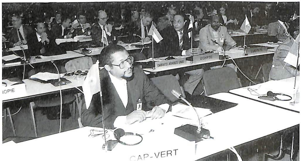
El representante de Cabo Verde.

La O.I.P.C.-Interpol cuenta desde ahora con 150 miembros.