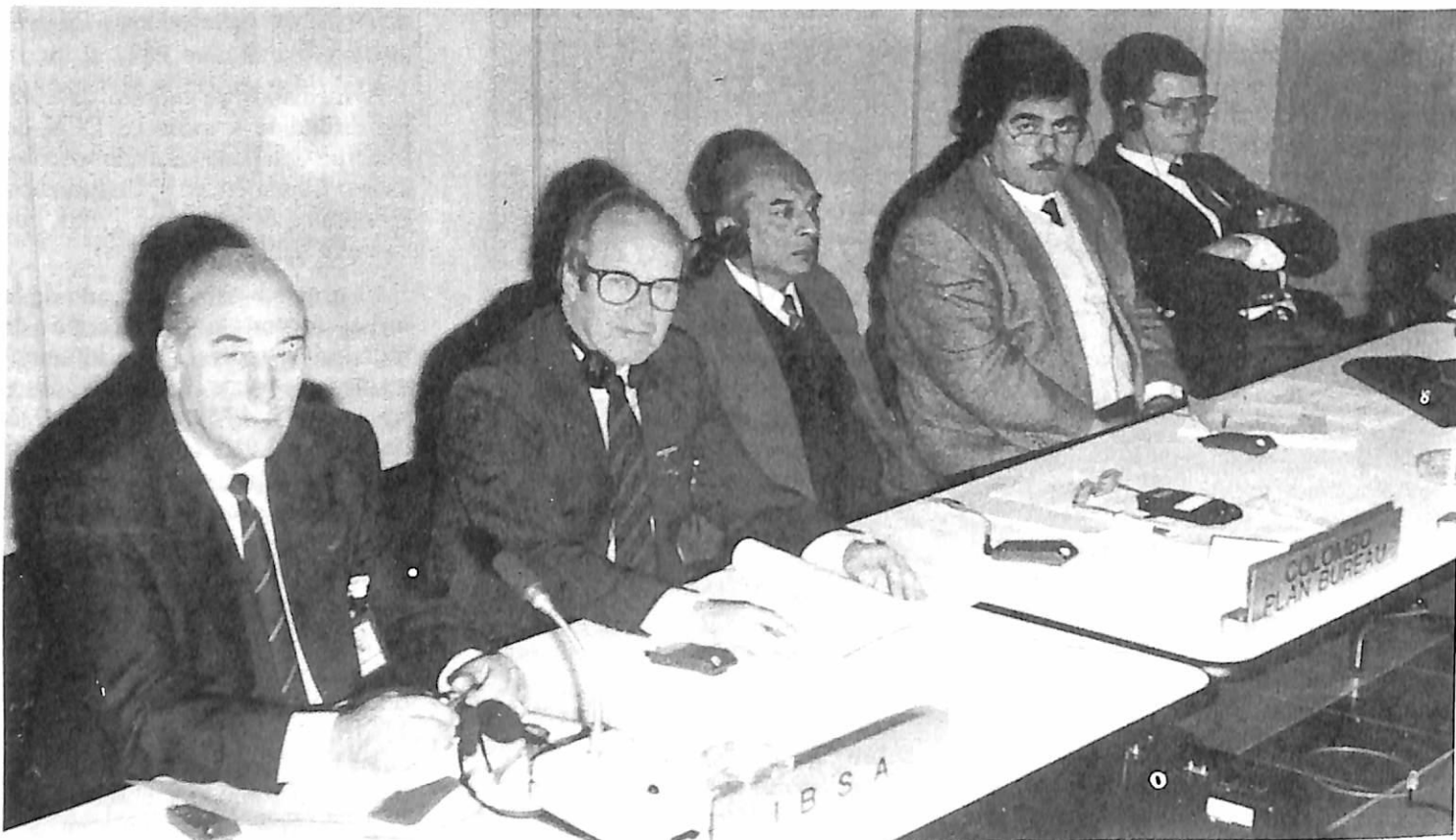
Los representantes de algunos organismos presentes a título de observadores.

descubiertas en 1986, informe sobre la falsificación de moneda en 1987.