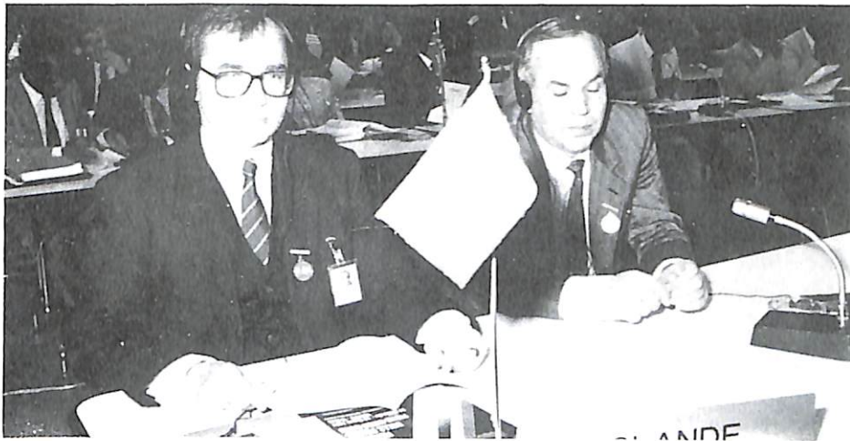
La delegación islandesa.

comunicaciones del Caribe y América Central», conforme a su objeto y a la resolución AGN/55/RES/4;