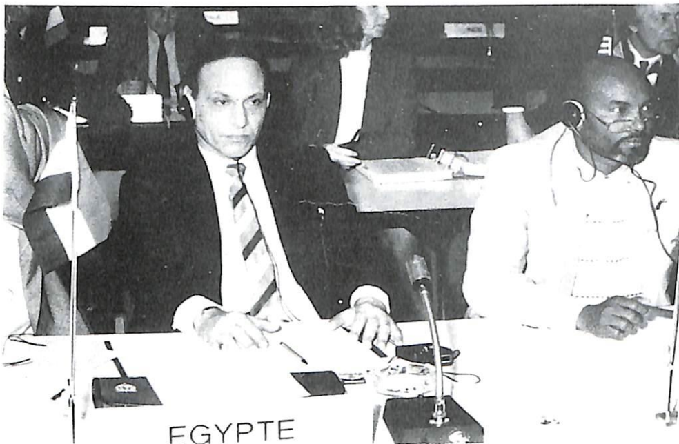
El delegado egipcio.

Se realizaron importantes mejoras en el AMSS con el fin de disminuir los costes de explotación, mejorar la eficacia de la red y la calidad del servicio en beneficio de las OCN. Dentro del marco general definido por la Asamblea de Niza, la norma X-400 fue escogida como el eje de desarrollo de la red de telecomunicaciones de la Organización. La