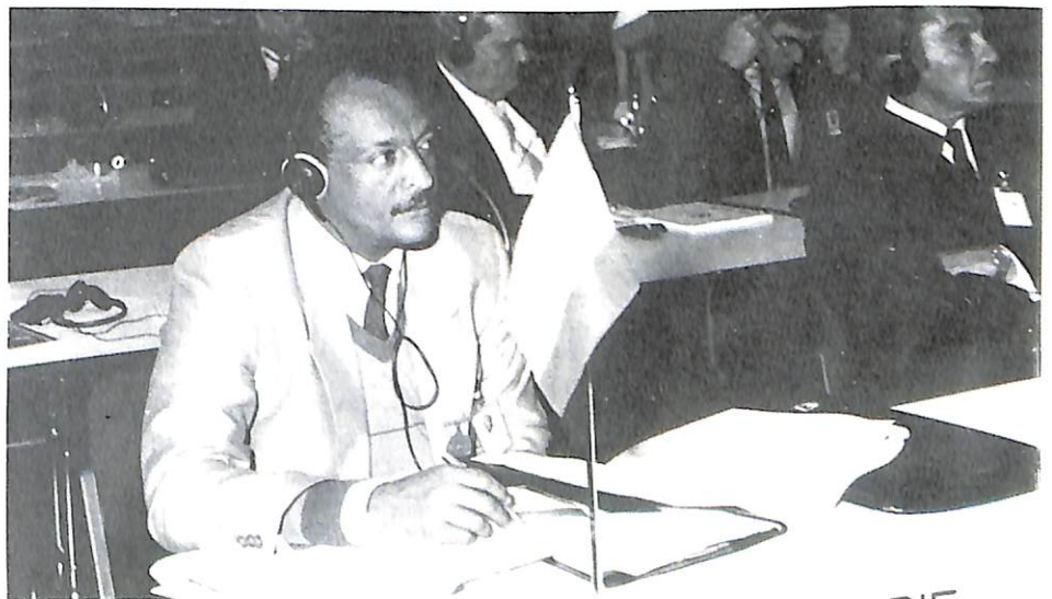
El delegado de Etiopía.

nominal de la propuesta por el Comité Ejecutivo para 1990, salvo modificación importante de los datos económicos incluidos en este plan.