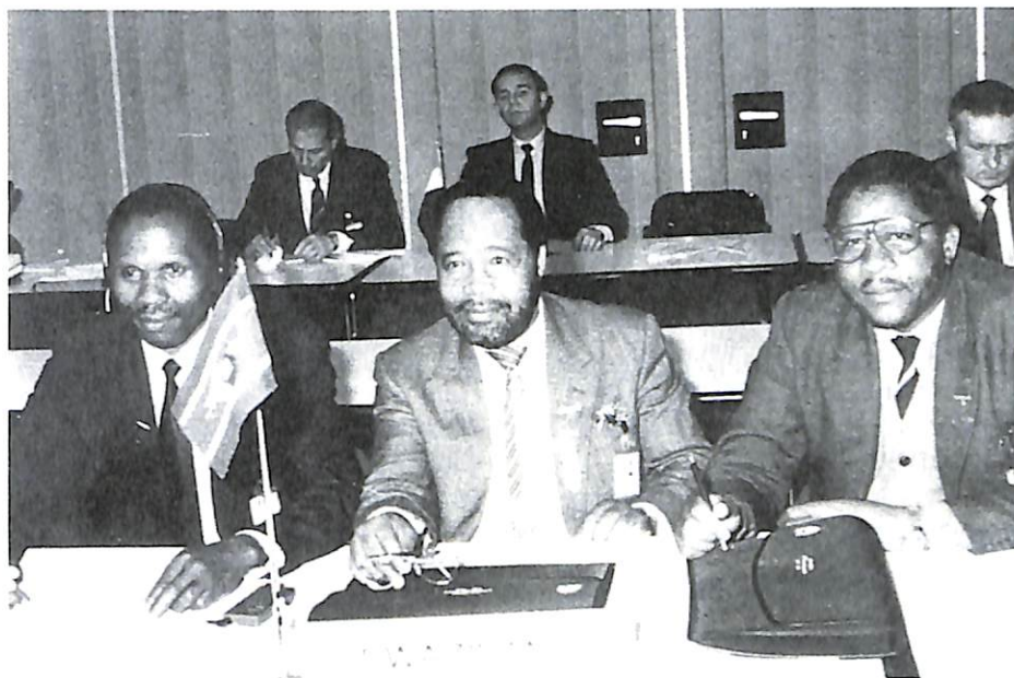
La delegación de Swazilandia.