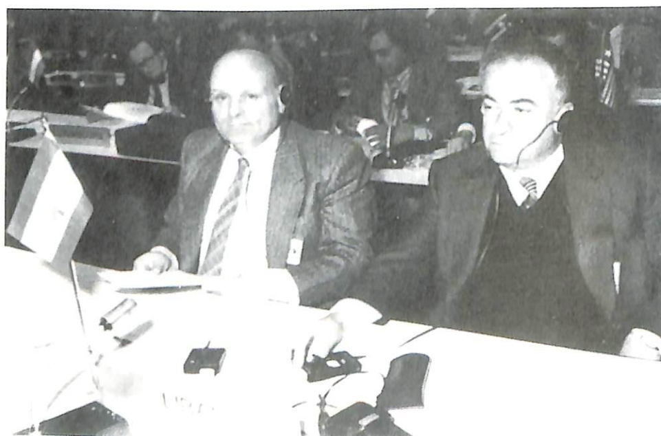
La delegación del Líbano.

Ha sido mejorada la política de gestión de la tesorería, y se han tenido en cuenta en gran medida las nuevas facilidades ofrecidas por los bancos franceses que aceptaron, desde principios de este año, retribuir las cuentas corrientes de la Organización.