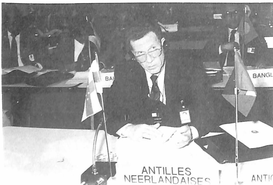
El delegado de Antillas Holandesas.

Otros muchos productos químicos han sido objeto de incautación, tráfico o desvío, ya que los responsables de los laboratorios clandestinos continúan cambiando los productos químicos utilizados así como los métodos de producción para evitar ser descubiertos.