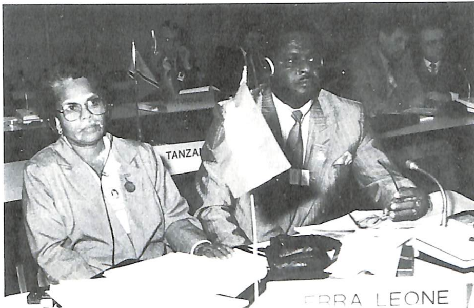
La delegación de Sierra Leona.

Al 31 de diciembre de 1988, la cifra total del personal de la Secretaría General era de 258 funcionarios, de los que 63 están puestos a disposición, 23 destacados y 172 agentes contratados. Treinta y cinco nacionalidades están representadas: la alemana, americana, australiana, argentina, argelina, austriaca, inglesa, belga, canadiense, colombiana, danesa, española, egipcia, francesa, griega, holandesa, italiana, irlandesa, iraquí, libanesa, japonesa, camboyan, paquistaní, noruega, filipina, senegalesa, sri-lanquesa, sueca, sudanesa, siria, tailandesa, tunecina, turca, uruguaya, portuguesa.