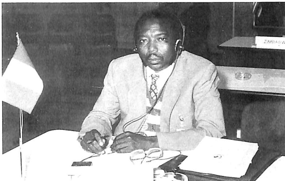
El delegado del Chad

El grupo E se ocupa de las actividades fraudulentas que se basan en la estafa o el engaño y de los delitos designados generalmente bajo la apelación «de guante blanco». El trabajo de este grupo, especialmente complejo y diversificado, exige mucho tiempo y mucho personal.