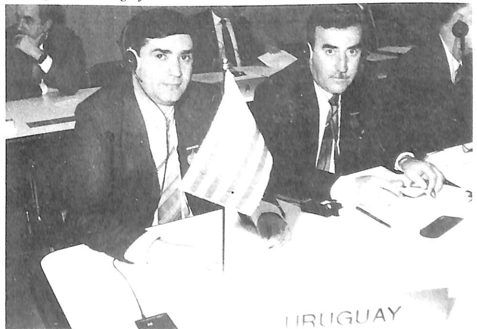
La delegación de Uruguay.

las organizaciones delictivas (delincuencia organizada).