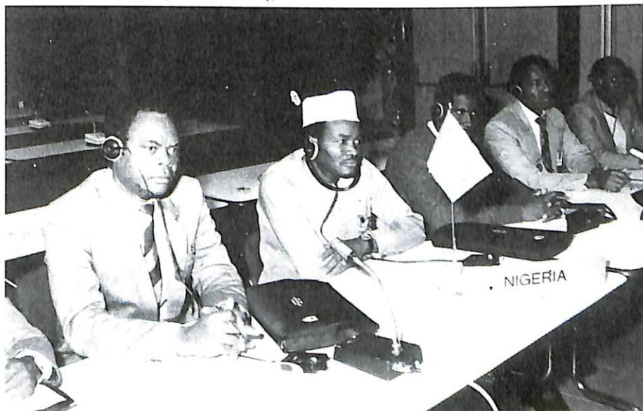
Miembros de la delegación de Nigeria

SOLICITA a la Secretaría General que proceda, en cooperación con los organismos competentes de la Organización de las Naciones Unidas, a la realización de un estudio que tenga como objetivo la proposición de todas las iniciativas que permitan la mejora de la cooperación internacional en la prevención y represión de los delitos de los que son víctimas las personas menores, informando regularmente al Comité Ejecutivo de los progresos realizados en este trabajo.