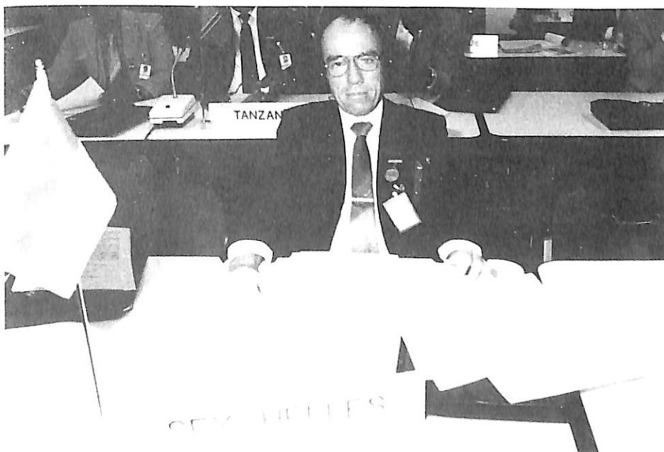
El delegado de Seychelles.

(especialmente en inglés, francés, español, alemán e italiano); por otra parte, el servicio está abonado a 173 revistas procedentes de 25 países.