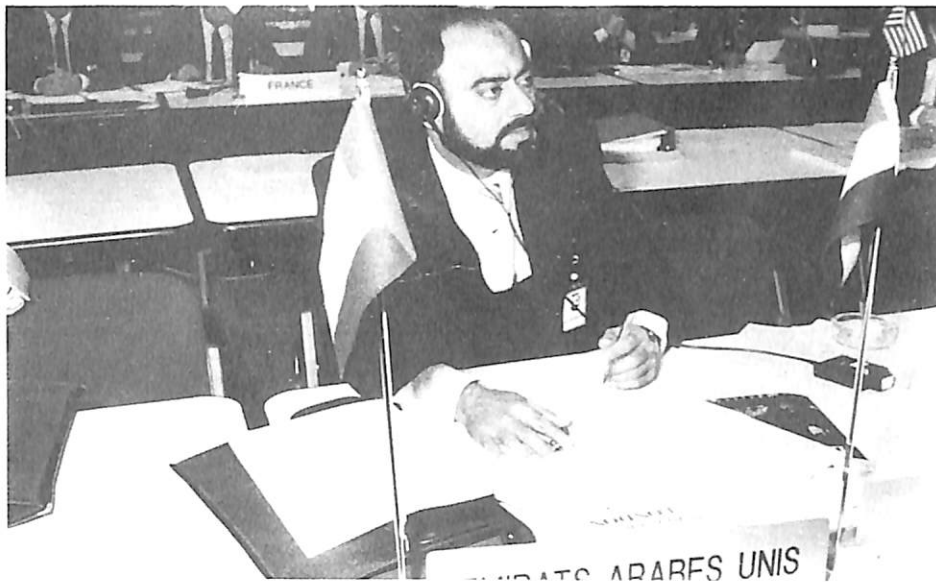
El delegado de los Emiratos Arabes Unidos.

Se han difundido a las OCN 118 formularios sobre las investigaciones de la policía científica así como 10 circulares.