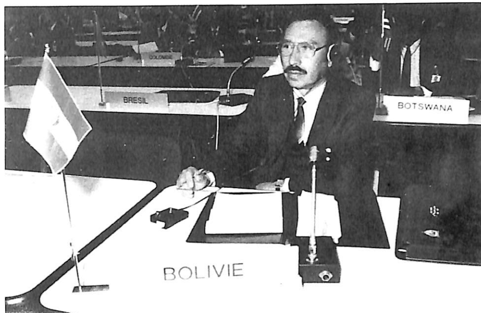
El delegado de Bolivia.

En 1988, el grupo de captura de datos abrió los siguientes expedientes: