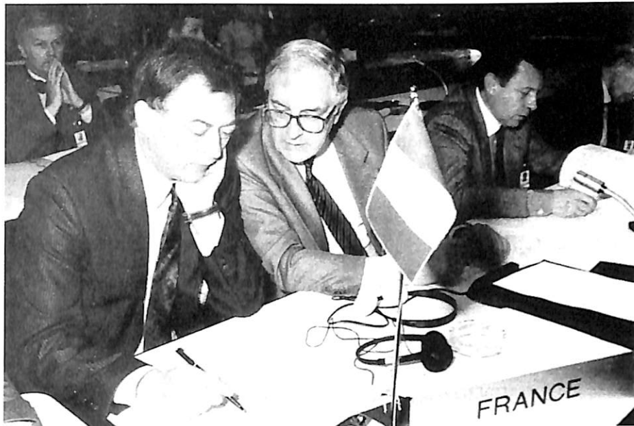
Una parte de la delegación francesa.