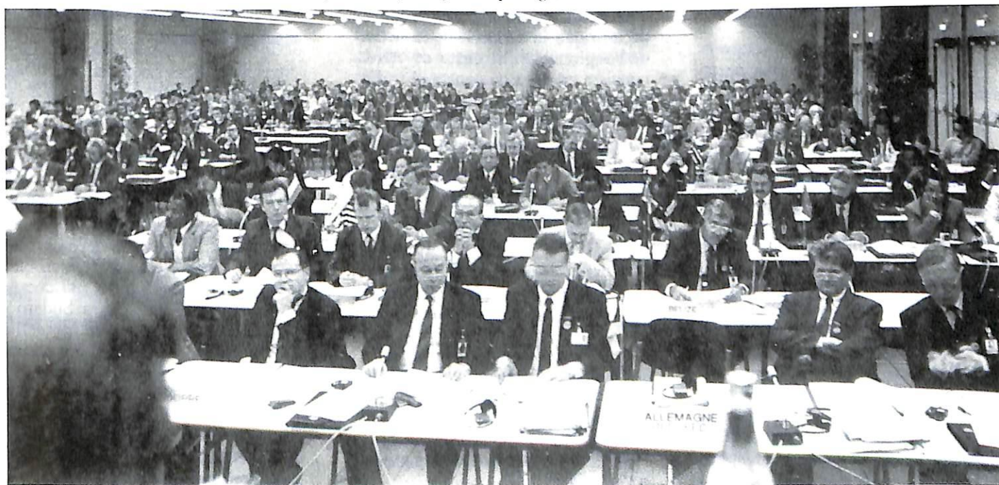
Vista de la sala de conferencias en sesión plenaria.

SOLICITA al secretario general que se edite y se difunda a todas las Oficinas Centrales Nacionales;