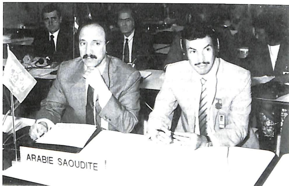
Dos delegados de Arabia Saudita.

La Asamblea General de la OIPC-Interpol, reunida en su 58 sesión en