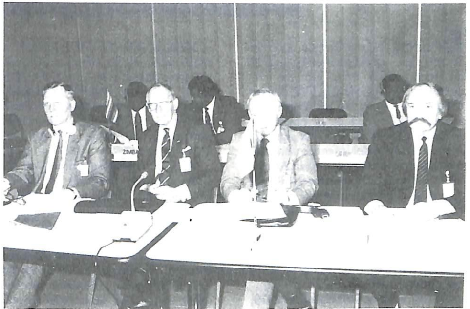
Miembros de la delegación sueca.

Evidentemente, el terrorismo internacional continuará constituyendo una preocupación capital para los servicios de represión. La OIPC-Interpol continuará, de la manera que le es propia y sin crear dificultades, sosteniendo y sirviendo a los países miembros en su lucha contra el terrorismo internacional. Se proseguirán los programas emprendidos y la Secretaría General tiene la intención de difundir más informes en el futuro. Estos informes serán elaborados a partir de las informaciones recibidas y gracias a los resultados procedentes de una base de datos enriquecida y de los medios de análisis más importantes.