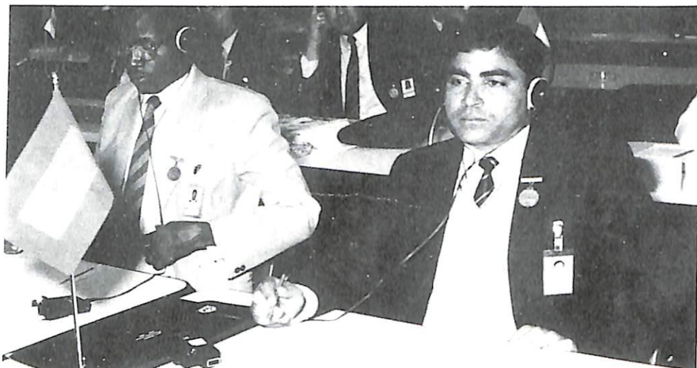
El delegado de Maldivas.

mente los plazos fijados y la partida financiera destinada a este programa.