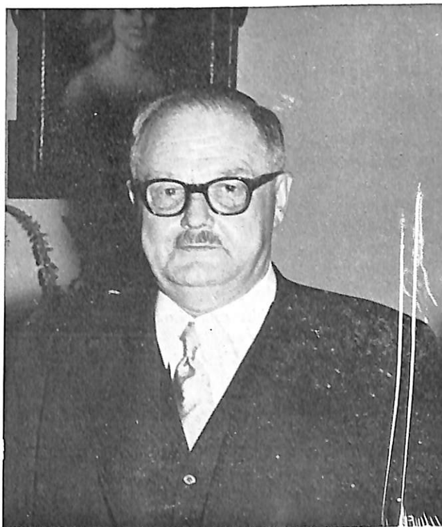
El Sr. Canciller de Austria, Julius RAAB.

en el curso del último cuarto de siglo la Comisión Internacional de Policía Criminal se ha convertido en una importante organización. Todos ustedes saben, por la experiencia de su trabajo cotidiano, que sólo la organización de ustedes ofrece la garantía de luchar contra la criminalidad moderna más allá de las fronteras nacionales, con las armas modernas. La idea de una cooperación internacional, en el terreno de la policía criminal, era tan sólido desde 1938 que ha subsistido después de la segunda guerra mundial, y poco tiempo después del fin de la misma. En 1946 la Asamblea general se reunió bajo la iniciativa de nuestro honorable Presidente. Se decidió por unanimidad reanudar inmediatamente las actividades. Los austríacos acogieron con júbilo esta decisión, y aunque reducidos a las posibilidades de un país ocupado, nosotros hemos acudido con gran voluntad a la llamada de la cooperación. Después, en el curso de los últimos diez años, vuestra organización ha evolucionado enormemente. Hoy, al comienzo de la 25