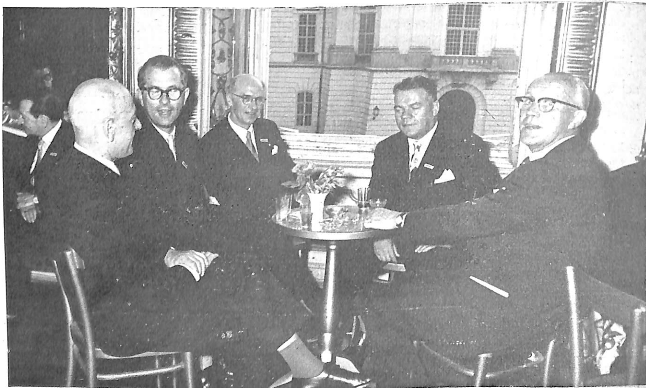
Los delegados escandinavos.

Es necesario ser muy circunspecto ante testimonios o declaraciones de menores. El niño es el Adulto de mañana: si el menor tiene confianza en la policía, continuará concediéndola esta confianza cuando llegue a la mayoría de edad. El conjunto de estos principios debe poder desprenderse según el informe, a raíz de un ciclo de conferencias sobre: la Psicología Juvenil; las causas de la delincuencia juvenil; las formas de la delincuencia juvenil; la situación legal del menor; la cooperación entre los parientes, maestros, asis-