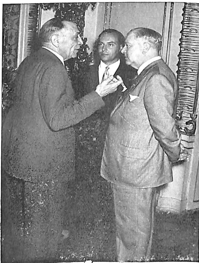
El Presidente LOURFNÇO charla con los Sres. IRINIZ (Uruguay) y HIERRO (España).

M. Nepote subraya, además, lo interesante que en todas las peticiones de búsqueda es la indicación de las circunstancias en que el delito ha sido cometido. La policía que procede a detención de un malhechor necesita conocer los hechos que se le imputan, aunque sólo sea para poder oponer el oportuno mentís a sus inevitables protestas.