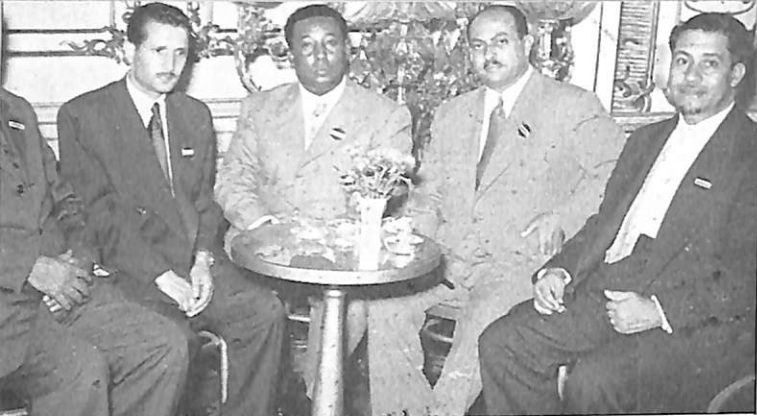
Delegados de los países árabes.

particular de su país. El año último un Comité especial del Senado canadiense ha desarrollado una vasta información en el curso de la cual numerosas personas de todos los medios han sido oídas. Se ha llegado a la conclusión de que el tráfico de estupefacientes debía ser tomado muy en serio. También las penas susceptibles de ser infligidas a los traficantes han sido reforzadas y pueden ser hasta de catorce años de prisión.