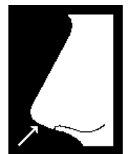
6 Vuelta hacia arriba