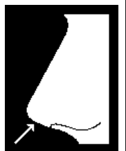
6 Turned up