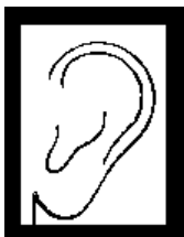
1 Not attached