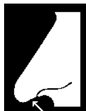
4 Turned down