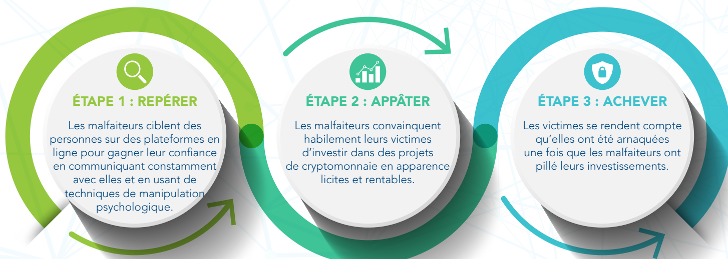
Les phases du "Pig butchering"